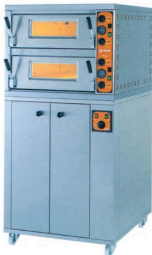
PIZZY DUO (S KYSIARŇOU)