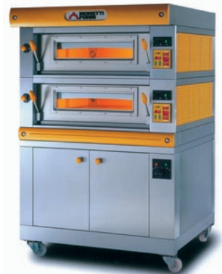
AMALFI / MODULO