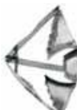
Pesce 48286-49 Long fish