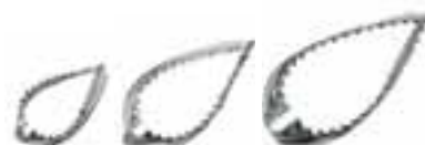
Set 3 foglie 48286-47 Set of 3 leaves