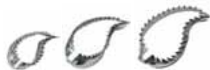
Set 3 foglie 48286-46 Set of 3 leaves