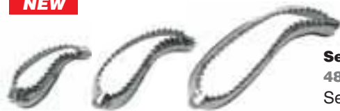
Set 3 foglie 48286-45 Set of 3 leaves