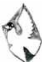
Uccello grande 48286-51 Long bird