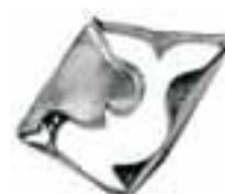
Delfino grande 48286-50 Long dolphin